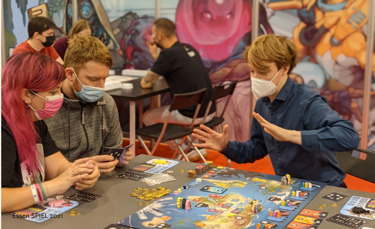
Essen SPIEL 2021