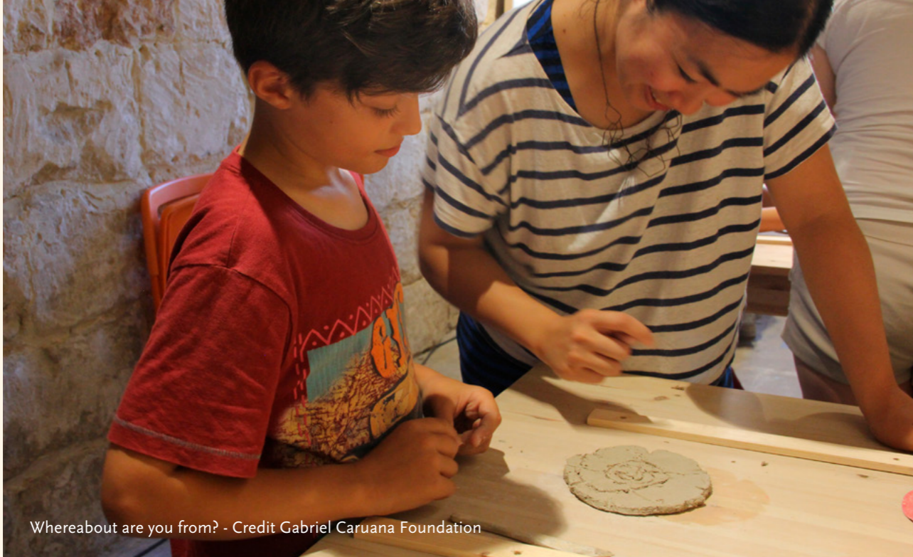
Whereabout are you from?