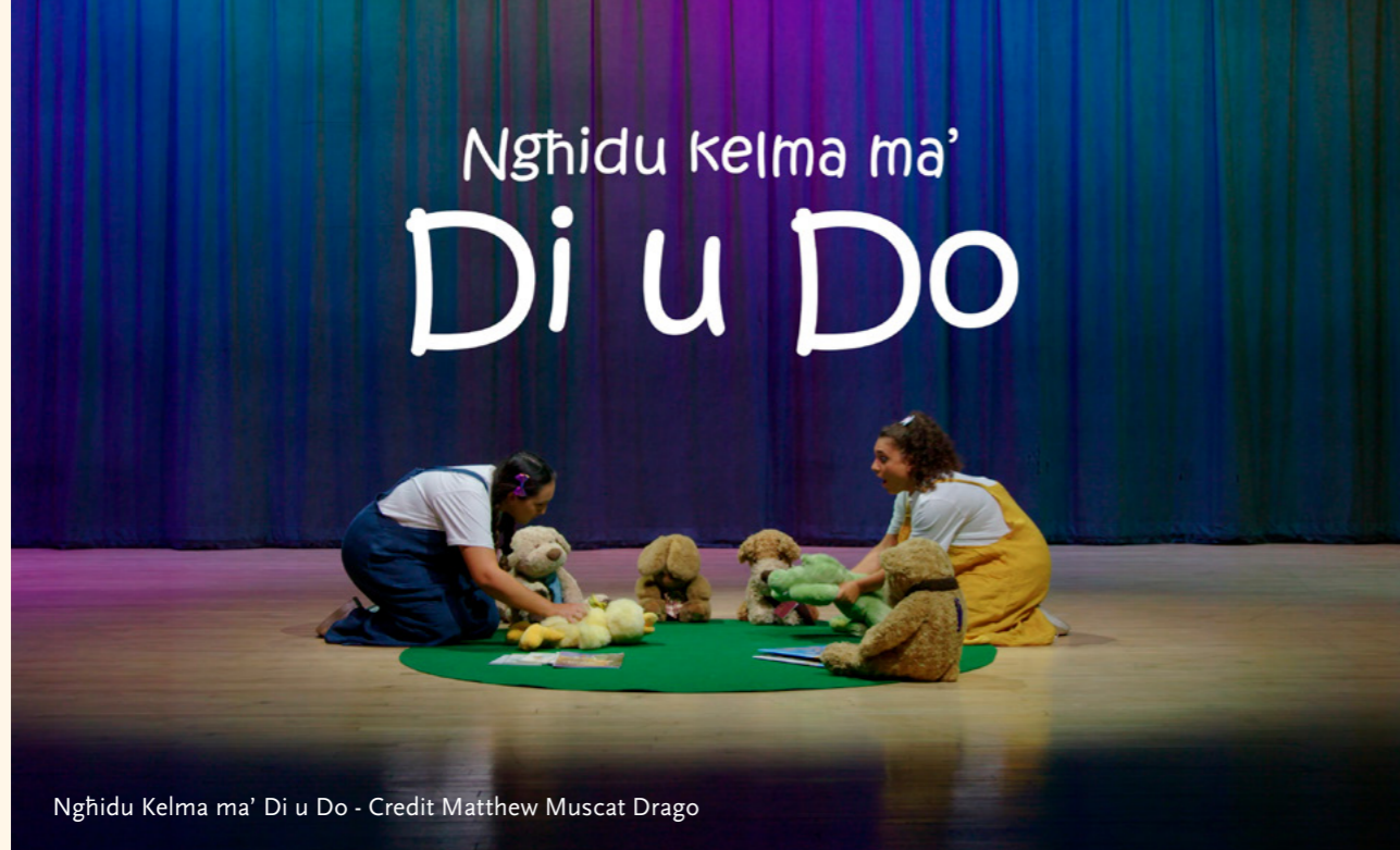
Nghidu Kelma ma' Di u Do